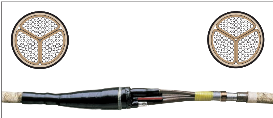
Кабель с общим экраном