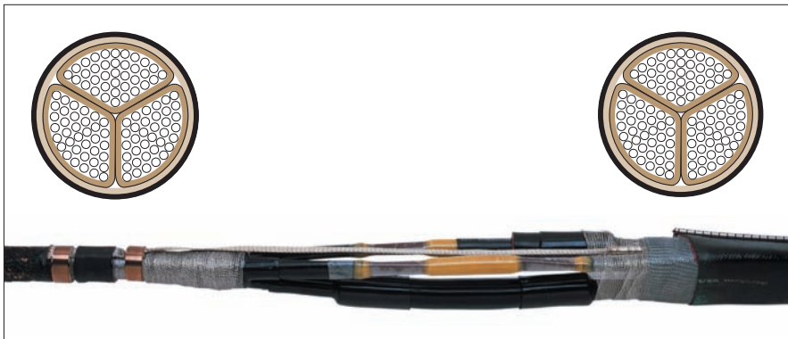
Кабель с экраном для каждой жилы